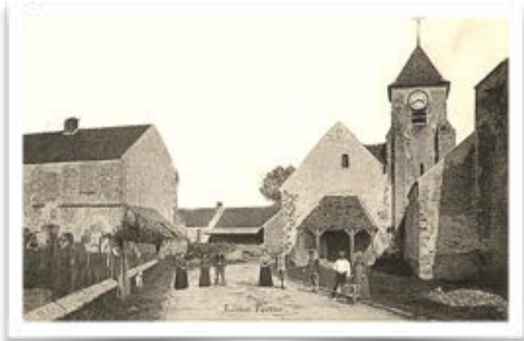
Eglise du Plessis-Feu-Aussoux