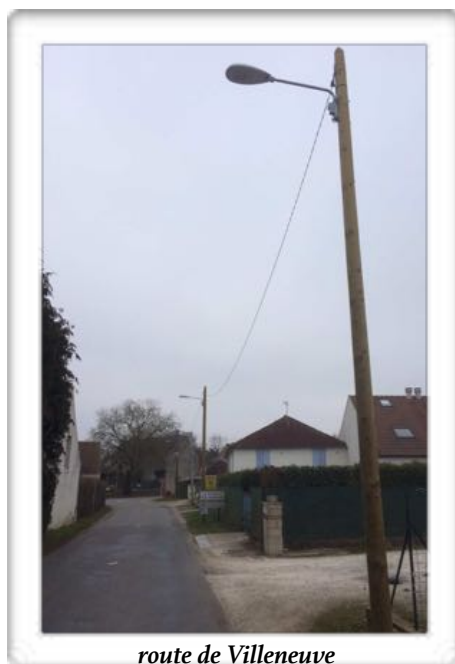
route de Villeneuve

La somme totale de ce programme de réfection de l'éclairage public s'élève à 8652,00 TTC.